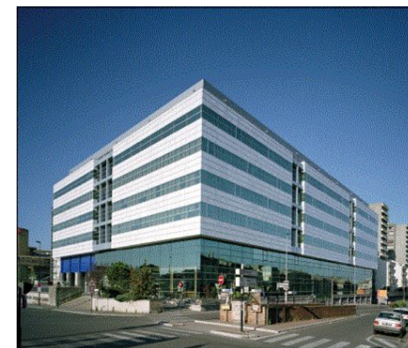
Le bâtiment des Chèques postaux de Bordeaux.