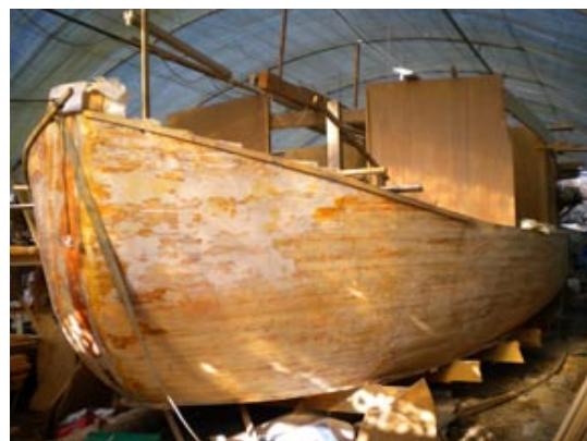
Les Amis de la Barque de Poste 1818. La barque en construction.

Comme jadis, Robert Mornet souhaite faire revivre aux passagers une aventure « authentique » et de renouer avec cet ancien mode de transport : un voyage aller de quatre jours, avec haltes gastronomiques dans les communes associées au canal du Midi. Pour en connaître davantage et découvrir toutes les étapes de la construction de cette barque, rendez-vous sur le site de l'association des Amis de la Barque de Poste 1818 : www.barquedeposte.org .