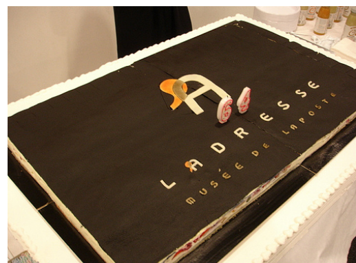
Le gâteau d'anniversaire !