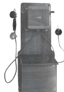
1910 mura