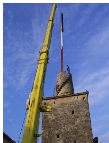
Ph. A. Bourg-Rius