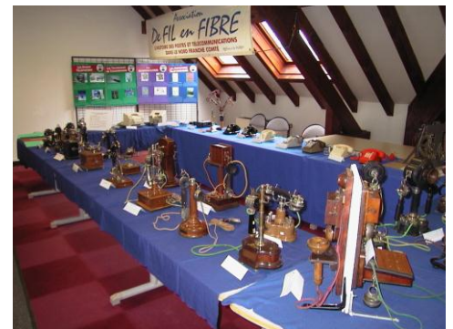
Stand De Fil en Fibre.