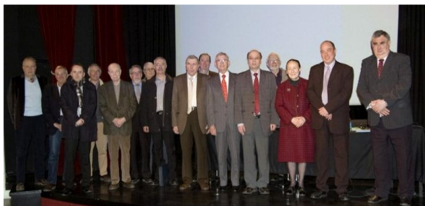
Une partie des membres du conseil d'administration.