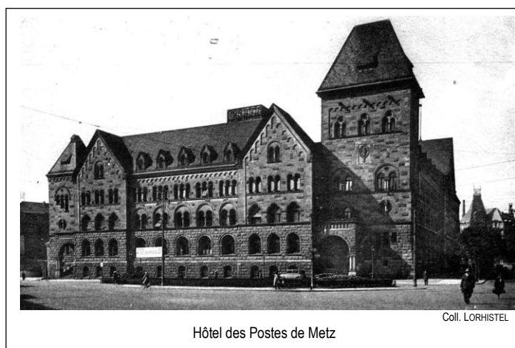
Hôtel des Postes de Metz

Contact : ANCI Lorraine • 1 place du Général de Gaulle • BP 69020 • 57037 Metz Cedex 1 •