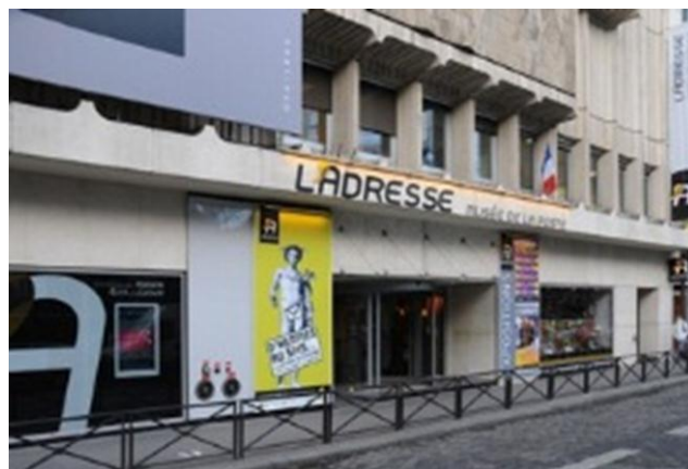
Façade de L'Adresse Musée de La Poste

Le 18 e colloque historique de la Fédération, qui se tiendra les 12 et 13 mai prochains à Paris à L'Adresse Musée de La Poste, sera riche de seize communications, toutes très diverses et originales.