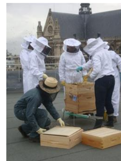
Les ruches sur le toit de La Poste du Louvre.

D'autres ruches ont également été installées sur le toit de la plateforme industrielle courrier de La Poste, dans la zone des Bouvets, à Créteil, ainsi qu'au sommet du centre de la rue François-Bonvin (15 e ). Cette installation a été rendue possible grâce au Syndicat national d'apiculture et de l'abeille de France (SNA).