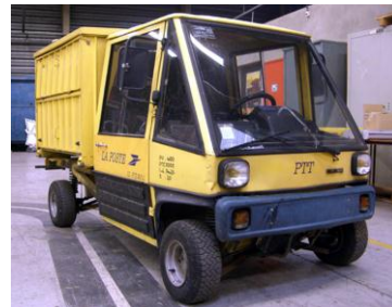
Voiturette JS 10 (inv. 2009.90.1) en livraison d'origine, du Musée

Les questions concernant ces véhicules sont très nombreuses et le Musée aimerait connaître les caractéristiques de chacun, les endroits où ses véhicules ont été utilisés, ce qu'ils sont devenus par la suite. Tous les renseignements ou/et les anecdotes, même considérés comme insignifiants, sont les bienvenus. Il suffit de les faire remonter à la FNARH qui reliera, ou en courriel à jcbfnarh@wanadoo.fr . Il sera fait état de toutes les réponses reçues dans différentes publications fédérales ou des associations.