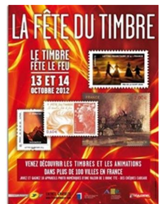
Affiche officielle de la Fête du Timbre 2012