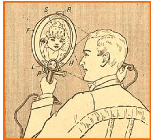
La Science et la Vie , 1918

En voici quelques extraits : « [...] On conçoit le futur instrument, qu'on a baptisé d'avance du nom de « téléphote » (du grec tele , loin, et photos , lumière) comme accessoire que l'on fixerait à un téléphone ordinaire, de manière à voir la personne à qui l'on parle, non seulement sous la forme d'un portrait immobile, mais telle qu'elle vit et agit à l'autre extrémité du fil. L'image serait recueillie sur une glace, comme l'indique l'illustration ci-contre. Pour être réellement pratique, un dispositif de ce genre ne devrait pas nécessiter la pose de lignes supplémentaires, en plus de celles qui servent au fonctionnement d'un téléphone ordinaire. Tout le monde sait que chaque poste téléphonique n'exige que deux conducteurs dont un seul fil métallique, car le deuxième conducteur, ou fil de retour, est constitué par la terre. Donc, avec un seul conducteur, on réalise toutes les exigences du service téléphonique ac-tuel : non seulement l'abonné peut parler à n'importe quel autre abonné, mais le bureau central peut également l'appeler, et vice versa . On peut même télé-graphier et téléphoner en même temps du même poste, sans augmenter le nombre des conducteurs. Dans la plupart des projets présentés jusqu'à pré-sent par les inventeurs, la réalisation du téléphote donnait lieu à la pose d'une grande quantité de fils dont le nombre atteignait quelquefois même plusieurs milliers.