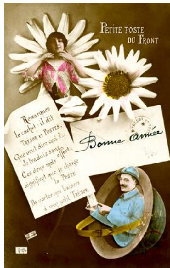
Carte postale