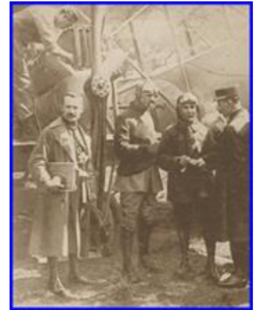
Le pilote avant le départ